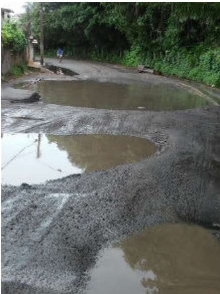
Estrada do Passarinho, entre Recife e Olinda, tem crateras que impedem até o tráfego de veículos maiores

O procedimento pode ser de indenização por danos materiais, contando apenas o prejuízo. Porém, quem precisa do veículo para trabalhar, como taxistas, podem também requerer o 'lucro cessante', ou seja, o valor que poderia ter sido ganho se não tivesse acontecido o acidente.